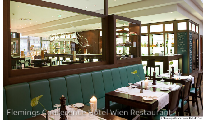
Flemings Conference Hotel Wien Restaurant