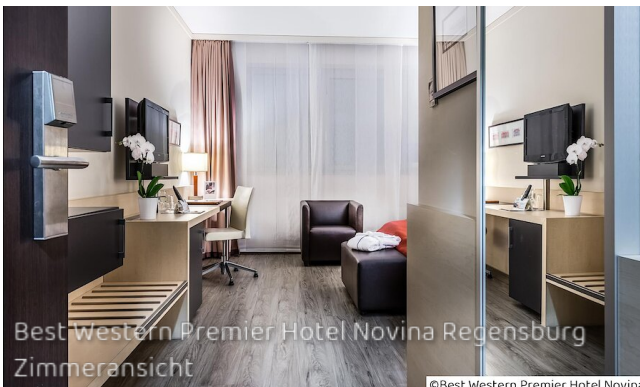
Best Western Premier Hotel Novina Regensburg Zimmeransicht