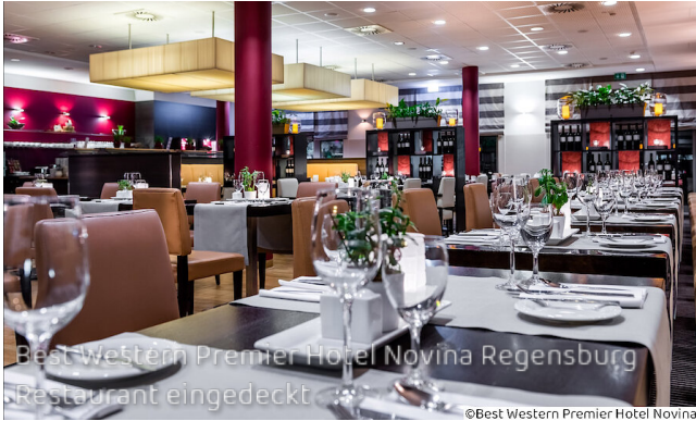
Best Western Premier Hotel Novina Regensburg Restaurant eingedeckt