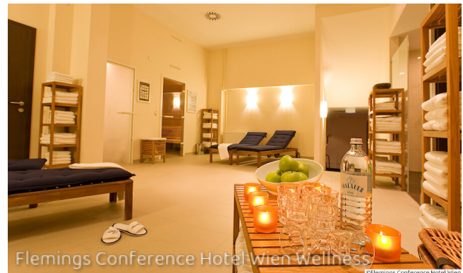
Flemings Conference Hotel Wien Wellness