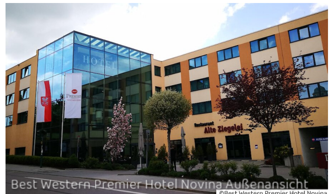
Best Western Premier Hotel Novina Außenansicht