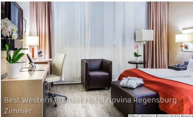
Best Western Premier Hotel Novina Regensburg Zimmer